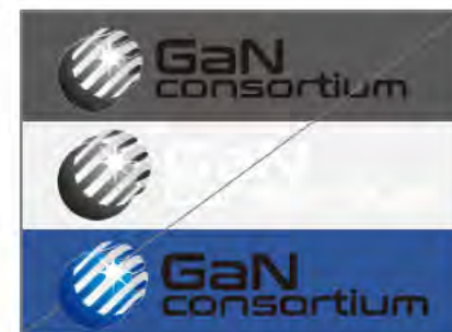
ロゴが見にくい背景を使う